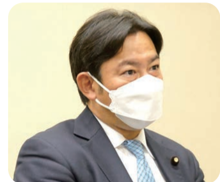
自由民主党 参議院議員 福岡 たかまる

昭和39年9月7日生(58歳) 【略歴】 平成3年3月 松本歯科大学卒業 平成21年4月 三養基・鳥栖地区歯科医師会理事 平成23年4月 佐賀県歯科医師会理事 平成29年6月 佐賀県歯科医師会専務理事 平成29年7月 佐賀県歯科医師連盟理事長 令和元年6月 佐賀県歯科医師会会長 令和元年7月 佐賀県歯科医師連盟会長 令和元年7月 日本歯科医師連盟評議員 令和3年7月 日本歯科医師連盟理事