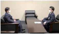
福岡たかまる 参議院議員 × 門司達也 佐賀県歯科 医師連盟会 長 (2、3面に記事掲載)

編集・発行人 西澤 均 年 6 回発行 (奇数月の 15 日) 定価: 1 部 105 円・年間 630 円 (税・送料共) 購読料は日歯連盟会費に含む