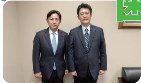
※撮影のためマスクを外しております