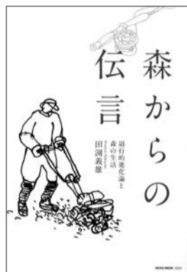
ネコ・パブリッシング社 本体 1,500 円+税