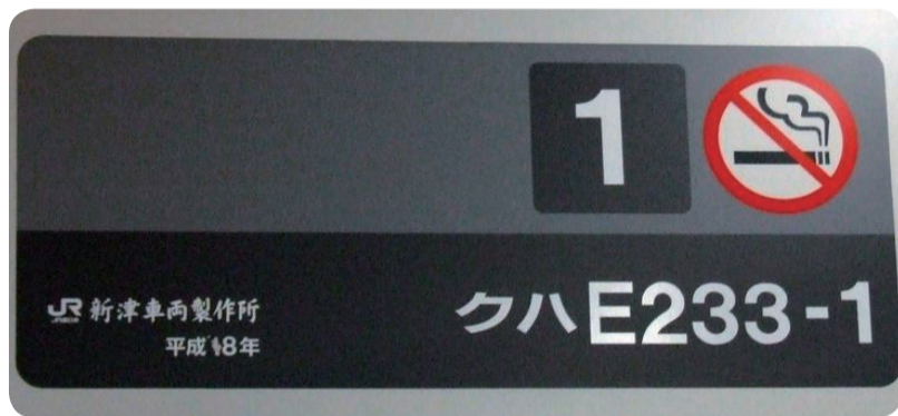
一度は見たことあるかなこのシール

具体的には、あくまでも組み合わせなので、『クハ』は運転席のある普通の電車、『モハ』はモーターのある普通の電車、『サハ』は運転席もモーターもない普通の電車、『クモハ』は運転席とモーターの両方がある普通の電車ということになります。 具体的には、東京のオレンジ色の線でお馴染みの中央快速線に所属する、クハE233-1ですと、JR東日本のEastの頭文字、