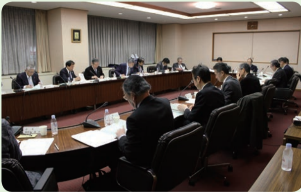
福岡県歯科医師連盟理事会のようす

り、親睦を深めるとともに、歯科界における現状や問題点等を報告させていただき、定例県議会において、地域歯科におけるむし歯予防