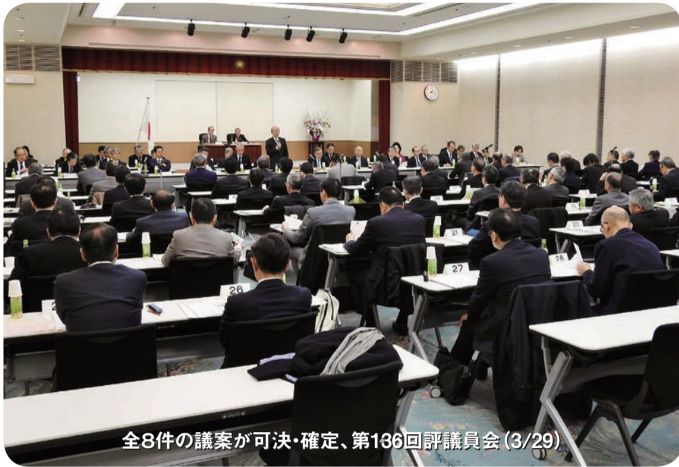
全8件の議案が可決・確定、第136回評議員会(3/29)