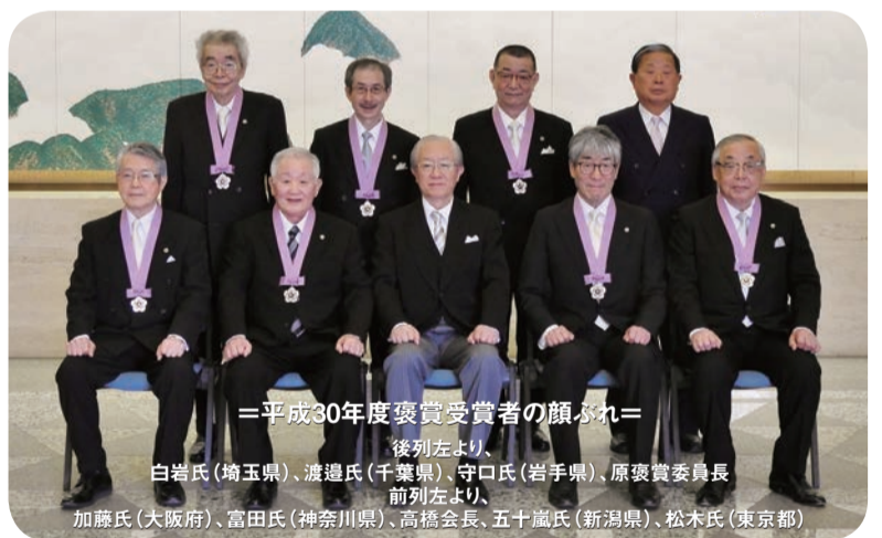
＝平成30年度褒賞受賞者の顔ぶれ＝