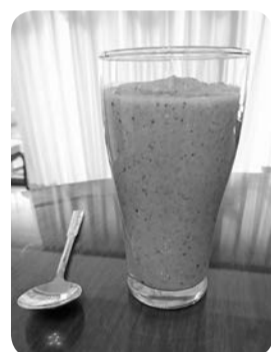
母特製の健康スムージー

髪も乾かし終わらして朝食ですが、朝食は母が作ってくれるスムージーだけです(写真)。約800cc位でしょうか。基本となる野菜は日によって違いますが、「リンゴ、人参、バナナ、トマト、ブルーベリー、生姜、ほうれん草、小松菜、ブロッコリー、ブロッコリー」の芽など野菜・果物以外は「きな粉、ゴマ、黒酢、アマニ油、はちみつなど」が入っています