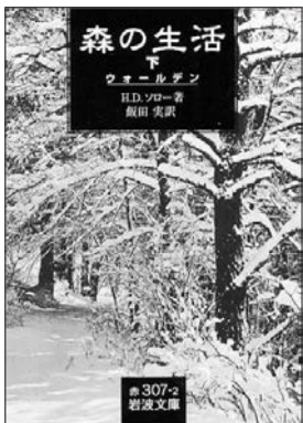
岩波書店 本体 920 円+税