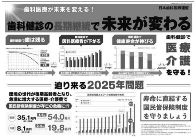
定期的な歯科健診がもたらす効果をグラフとデータを用いてわかりやすく解説!