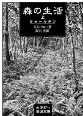
岩波書店 本体 840 円+税