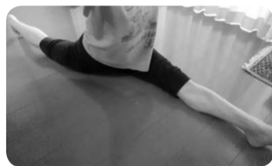
開脚で体の歪みを調整中

母が健康のために色々と考えてくれていたようです。とてもありがたいです。結構濃厚なのでスプーンですくって飲んでいました。