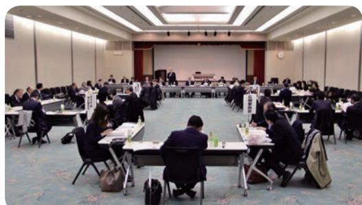
各委員会委員が再集結し答申書等について協議

朝日新聞社、産経新聞社、毎日新聞社、読売新聞社、NHK、テレビ朝日、BS-TBS、共同通信社、フリー医療ジャーナリスト(順不同)、歯科記者会加盟社より6社