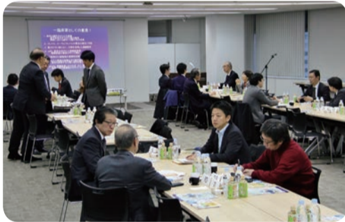
懇談する出席者ら

平成30年12月20日(木)、午後3時よりAP貸し会議室市ヶ谷にて記者懇談会を開催した。同会合は一昨年から4月以来三度目の開催で、今回は14社より17名(個人含む)の出席があった。