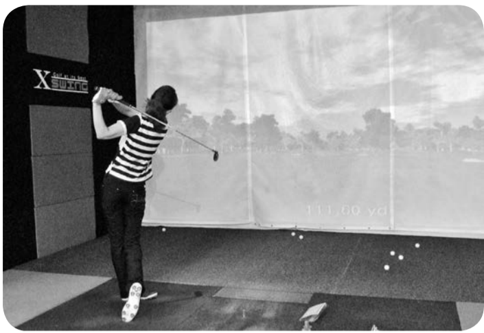
診療後でもナイスショット!!

ゴルフは、大学時代ゴルフ部に所属しており、歴だけは30年以上になります。ただ、それを言うのも恥ずかしい