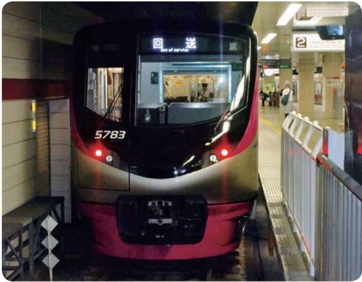
京王ライナー用5000系車両(京王八王子駅)