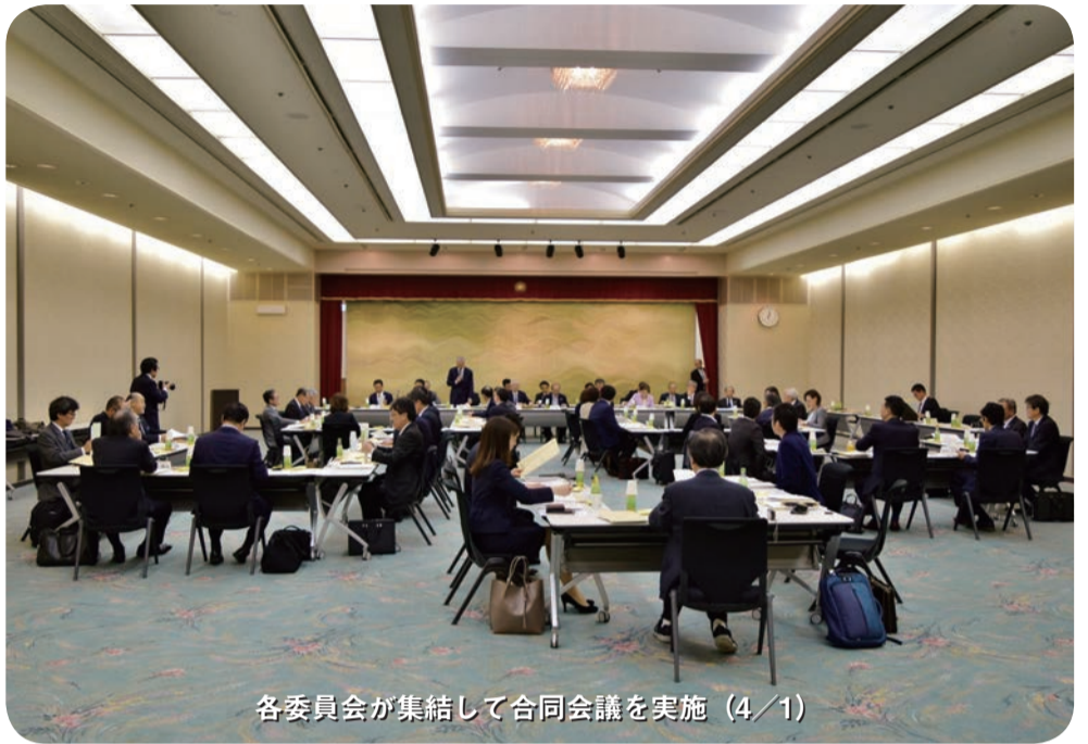
各委員会が集結して合同会議を実施(4/1)

平成30年4月1日(日)、午後1時より歯科医師会館にて日歯連盟各委員会合同会議及び第1回各委員会が開催された。まず合同会議では、本年度より活動を開始する選挙対応委員会、会員対策委員会、基本問題検討委員会、総務・情報委員会の4つの委員会委員及び担当役員が一堂に会して、高橋会長が目指す今後の本連盟の目標及び方針が示され、その内容を踏まえたうえで、午後2時からそれぞれ別の委員会ごとに分かれ、執行部より提示された諮問事項に基づき協議等が行われた。