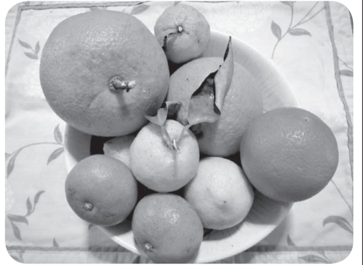
新鮮な果物で栄養満点のジュースに

です。さらに、カルシウム量が白米の3倍あり、アンチエイジングに効果的なビタミンEも含まれています。健康にも美容にも良い、とすぐに飛びつきました。