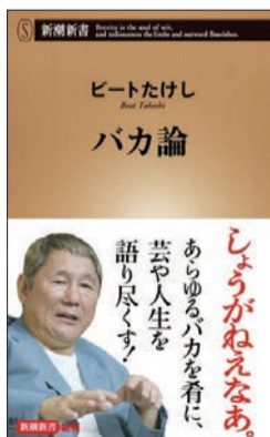
新潮社 定価：本体 778 円（税込）

ブラックユーモアたっぷりにズバツと切り込む語り口は痛快である。たけしフリークの方は本書でも紹介しているネットマガジン「お笑いKGB」 https://payment.owarai-kgb.jp/ （月額540円）に加入してみるのもいい。【田代高志】