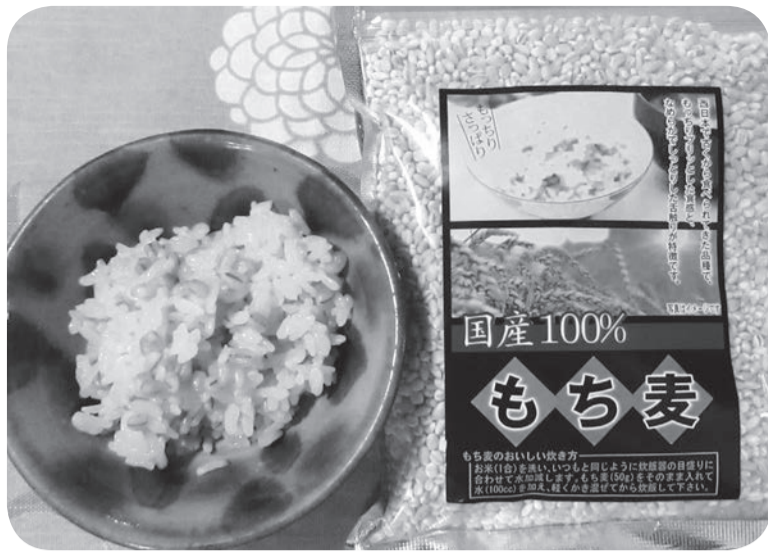
女性の味方!? 話題の「もち麦」

という説明にひかれて試してみたら、これが最初です。調べてみると「β-グルカン」は水に溶けると粘り気が出てきて、この粘り気が水分を吸収して膨らむことで満足感を感じたり、糖質や脂質、コレステロールの吸収を抑えるのだそうです。また、大腸で善玉菌のえさになり善玉菌を増やしてくれるそう