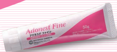
50g 標準価格 1,700円

一般的名称: 歯面研磨材 一般医療機器 医療機器届出番号 13B1X00154000022