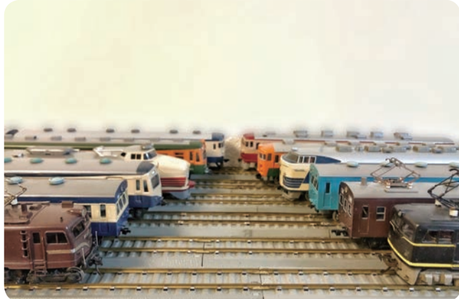
ザ・昭和の鉄道車両が勢ぞろい!

の年上の友人宅で、この眼差しで見ていた物だったのです。私のクリニックの駐車場で受け取りしたので、興奮して次々と開封しては、私(苦笑)の中にはほとんど新品のものや、模型店特製品までの物もありましたが、物によっては機能部分や車体にカビやサビ、腐食ありのものも。自分的には補修できそうでしたが(笑)これを見る半年程前に、1960年代初頭のものに手を出したばかりで、真鍮製の車体を直すために、半田こて等の道具を一式揃えたばかりでした。 是非これらを修復し、再び走らせてみたいので、ありがたうお譲りいただきたくと。今は本物に近付けるために、相当細かく作り込むのが主流ですが、これらはなるべく当時の形を尊重しつつ、少しだけ自分の好みを取り入れるスタイルに。コンセプトは「昭和40年代の鉄道少年のコレクション」大袈裟ですが(笑) このことを知った年上の模型仲間から、親父が持っていた古い部品を使う?など、当時の部品を譲っていただいていた修復し、車両の編成で足りない物は別の中古品を再生して足したりと…今では8割方できてきました。 歯科医師会入会時に気さくに話しかけてくださった先代、模型をお譲りくださった先生のお陰で、さらなる出会いを生むことになり感謝しております。今後も細く長く、この遊びを続けていきたいと考えています。 3回にわたり、私の駄文にお付き合いいただきありがとうございました。