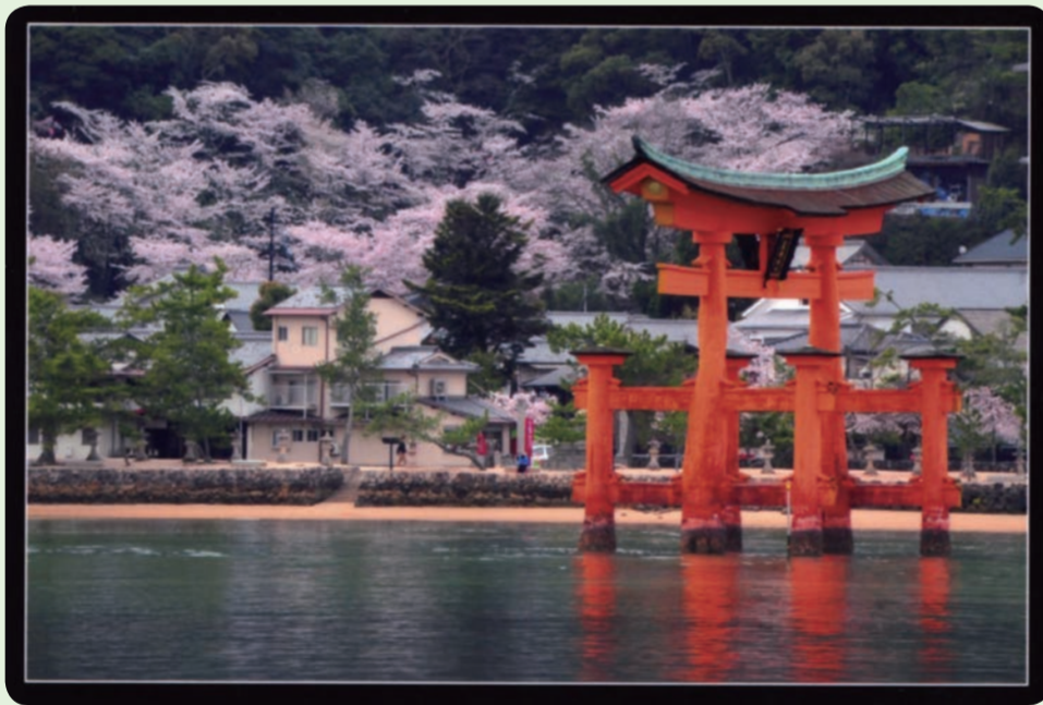
世界文化遺産厳島神社の大鳥居