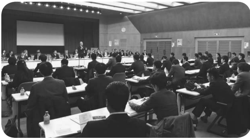
講演に聞き入る出席者

昨年末に発表された平成30年度診療報酬改定率 で、歯科がプラス0.69% (おおよそ207億円)の改定財源を獲得したことについて、日歯連盟は「会員の診療環境向上を」という同じ目的を持った組織であると説明した。