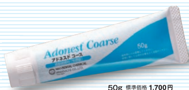
50g 標準価格 1,700円

一般的名称: 歯面研磨材 一般医療機器 医療機器届出番号 13B1X00154000023