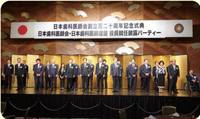
日本歯科医師連盟役員紹介（理事・監事）