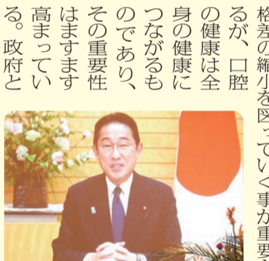
岸田内閣総理大臣からのビデオメッセージ

ように多くのご来賓、会員の先生方の前で役員をご紹介させていただいたのは本当に久しぶりである。これからも