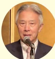
盛山文部科学大臣