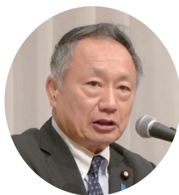
山田 宏 参議院議員