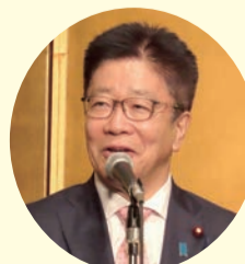
加藤厚生労働大臣