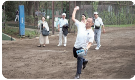
始球式のため投球練習する山田参議院議員