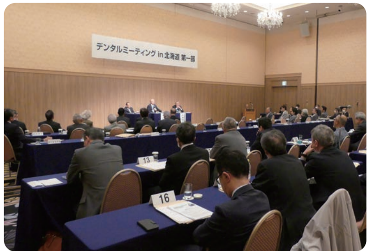
多数の取材が入るなど、デンタルミーティングは盛会裏に行われた