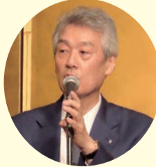
松本日本医師会会長