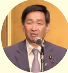
関口自民党参議院議員会長