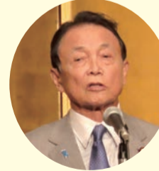
麻生自民党副総裁