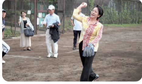
始球式のため投球練習する比嘉参議院議員