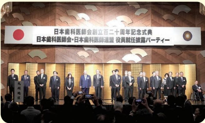
日本歯科医師連盟役員紹介（副会長・理事長・副理事長・常任理事）