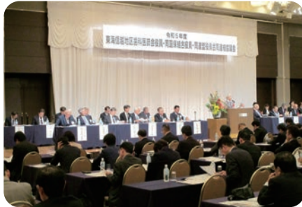
令和5年度東海信越地区歯科医師会役員・同国保組合役員・同連盟役員合同連絡協議会が10月21日(土)に長野市内のホテルを会場に開催された。東海信越地区6県から総勢200名近くの関係者の参加を得て盛大な協議会となった。