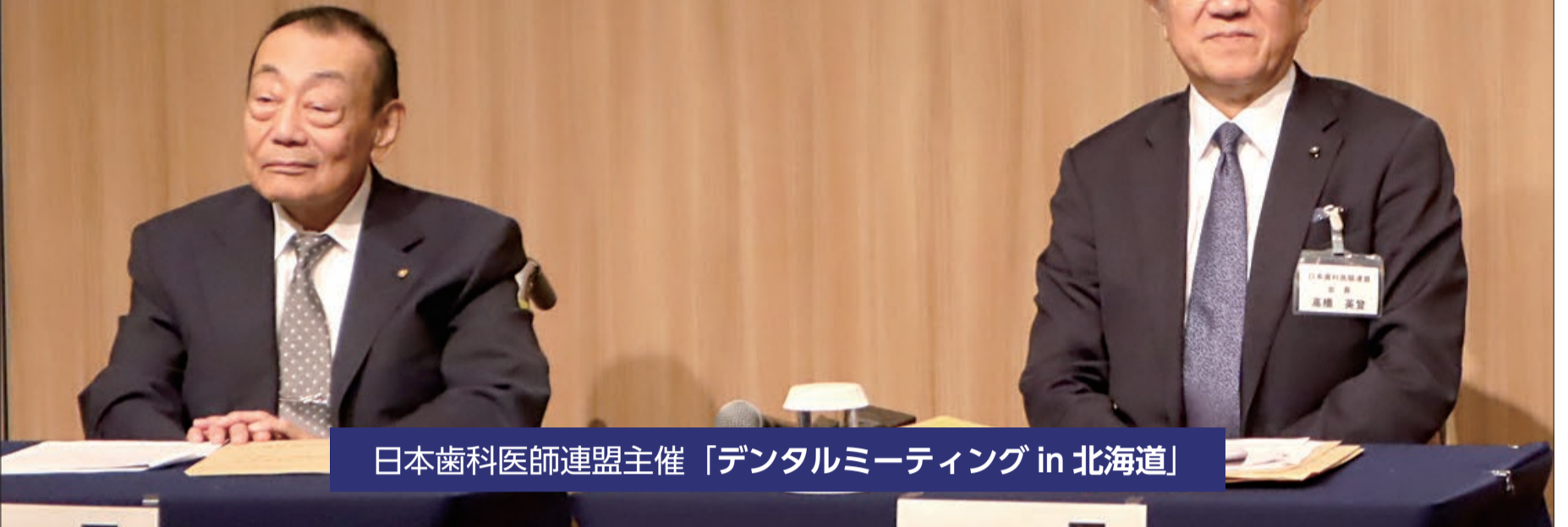
日本歯科医師連盟主催「デンタルミーティング in 北海道」