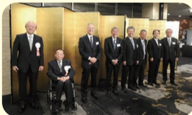
日歯・日歯連盟の会長、副会長によるお出迎え

ように多くのご来賓、会員の先生方の前で役員をご紹介させていただいたのは本当に久しぶりである。これからも