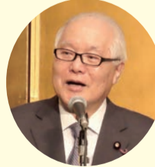
武見厚生労働大臣