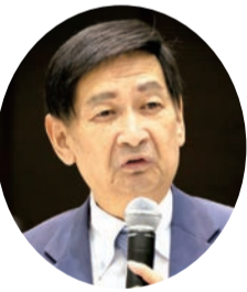
関口参議院議員会長

島村議員は、亡くなる1週間前に会館にお出でになり色々なアドバイスをお聞かせくださいました。益々のご活躍が期待される63才という若さでのご逝去に残念でない。ご遺志をしっかりと受け止め一層頑張ることを誓った。衷心よりご冥福をお祈りする。 関口昌一 自民党参議院議員会長