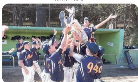
胸上げる札幌歯科医師会チーム