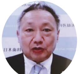
山田参議院議員 (web画面より)

浦田理事長から一般会務報告、会員数報告、富士副理事長から会計現況報告が行われた。「報告に対する質問等」木幡孝評議員（福島県）山田宏先生（山田）の質問をユニチューブで拝見したが、良い質問で、いい答弁を引き出していた。是非ホームページに掲載して欲しい。浦田理事長 山田事務所が