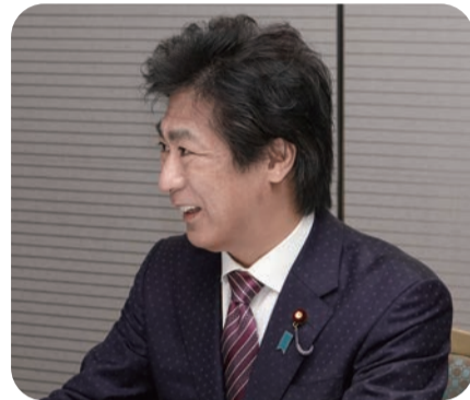
自由民主党 衆議院議員 田村 憲久

昭和39年12月15日生 衆議院三重県第1選挙区(津市・松阪市) 【学歴】 昭和58年 三重県立松阪高校卒業 昭和63年 国立千葉大学法経学部卒業 【経歴】 平成8年10月 衆議院議員初当選 平成29年10月 衆議院議員8期連続当選 【現職】 厚生労働大臣(2回目) 働き方改革担当大臣 【主な経歴】 厚生労働大臣、裁判官訴追委員会委員長、衆議院厚生労働委員長、総務副大臣、文部科学大臣 政務官、厚生労働大臣政務官、自由民主党政務調査会会長代理、自由民主党新型コロナウイルス関連肺炎対策本部本部長、自由民主党厚生労働部会長、ほか